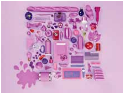
PANTON Color of the Year 2014 "Radiant Orchid"

写真は、アメリカに本社を持つ色見本などのグラフィック関連事業を展開するPANTONE(パントン)が予測している2014年の流行色です。この色はRadiant Orchid(ラディアント オーキッド)と名付けられ、ピンクとパープルを調和させたもので、喜びや愛情、健康を纏うカラーと位置付けられています。