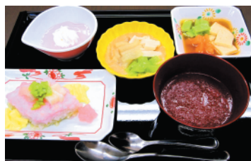
▲ウェルビーソフト食「雑寿司」