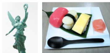
▲ソフト食「握りずし」