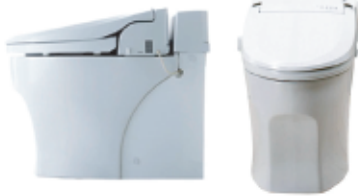
ジャニス「スマートクリン」