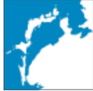
Fig.5 日本海を中心にした 南北逆さの日本周辺地図