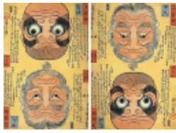
Fig.1 歌川国芳の大判錦絵 『両面相だるま・げどふ、伊久・とくさかり』