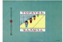
Fig.6 ピーター・ニューエルの絵本 『Topsy and Turvys』