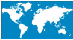
Fig.4 大西洋が中心の世界地図