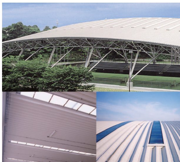
▲製品である「スカイトップライト」。自然の光だけで明るくなります。