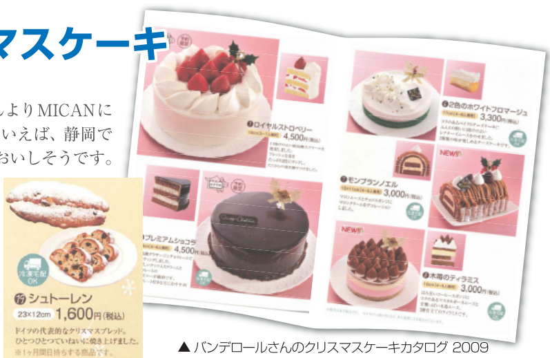
▲バンデロールさんのクリスマスケーキカタログ 2009

だんだんと肌寒くなってきましたね。もうすぐクリスマスです。クリスマスといえば、クリスマスケーキ! (株)バンデロールさんよりMICANにクリスマスケーキのカタログが届きました。バンデロールさんといえば、静岡で大人気の「のっぼパン」のパン屋さんですが、ケーキもとってもおいしそうです。定番のイチゴのショートケーキから、ショコラ、フロマージュ、モンブラン、ティラミス…と、種類もたくさんで迷ってしまいます。クリスマスパーティには欠かせないケーキ、そろそろ予約してはいかがでしょう。ケーキの他にパーティ用のサンドイッチやピザなどもあります。MICAN受付にて特別価格(通常価格の20%OFF)で予約承りますのでお気軽にお声かけください。【予約締切 12/14 (月)】クリスマスが来るのが待ち遠しくなりますね。