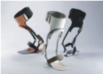
短下肢装具"ゲイトソリューションデザイン"川村義肢(株) (デザイン: (株)GKダイナミクス)

手足に障がいをもつ肢体不自由の人の数は約180万人といわれています。この多くの人たちのための、より良い装具づくりが課題となっています。写真は、川村義肢株式会社の短下肢装具"ゲイトソリューションデザイン"という肢体不自由な人のための装具です。