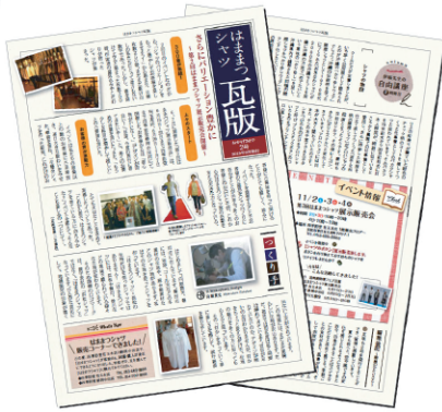
はままつシャツ瓦版

シャツづくりの新しい動きが、静岡県の各地で生まれています。一つは県が主導でデザイン開発したサムライ・シャツ武襦袢(MUSYA)です。これは、県の繊維産業(遠州織物)を県内外にアピールすることを目的に、2012年に実施した「遠州織物夏服デザインコンテスト」の結果生まれたものです。遠州織物のよさを地域の作家たちがシャツづくりに活かそうという動きをしているのが「はままつシャツ」グループです。このグループは、作家、メーカー、販売店、デザイナー、有識者などと着る人をつなぐ様々な活動を始めています。これ以外にも、地域の特性を活かしたご当地シャツともいべき焼津の魚河岸シャツ、島田の帯シャツ、大井川の恵シャツ、清水シャツ・清水湊町シャツ・濱シャツなどがあります。